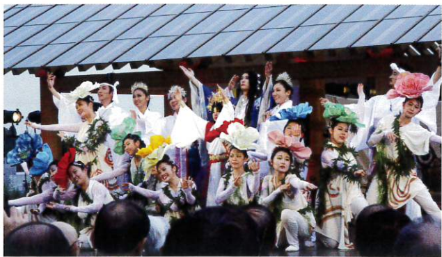
多賀城創建を「naturallyな色と音の世界」を通して表現

1月1日、多賀城創建1300年を祝う記念式典が特別史跡多賀城跡で行われ、県内外からの来賓や市民など約500名が列席した。式典は、ドラムの独奏で幕を開けた。アートプログラム「陸奥国府